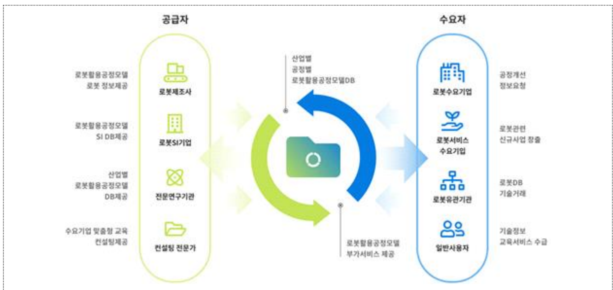
<표준공정모델 활용 체계>