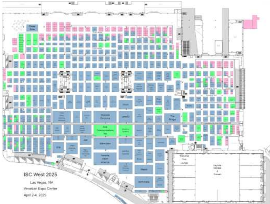
전체 부스 도면(ISC WEST 2025)