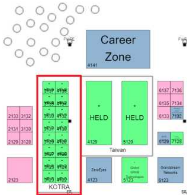
한국공동관 부스 배치도(ISC WEST 2025)